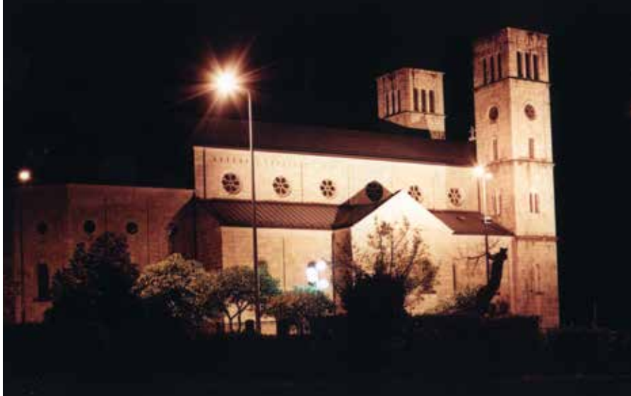
ŠIROKOBRIŠKA LJEPOTICA – SAMOSTANSKA CRKVA UZNESENJA BDM. SVJETLO U SVAKOM MRAKU.

Za ovih teških noćnih napadaja franjevci, koji su živjeli u samostanu, utekli bi u podzemno sklonište, koje je bilo u tu svrhu napravljeno, kojih 25 metara od glavnog ulaza u samostan. Po danu je to sklonište korišteno kao zaklon protiv zrakoplovnih bombi. Drugo ovakvo sklonište nalazilo se je kod same električne centrale blizu rijeke Lištice. Ovo sklonište bilo je sigurno protiv bilo kojeg neprijateljskog oružja, jer je bilo ukopano u strmini brda, obraslo gustom grabovom šumom, gdje neprijateljski topovski i tenkovski pogodak nije mogao uopće pogoditi, niti su ga najveće zrakoplovne bombe mogle uništiti. Ta dva sklo-