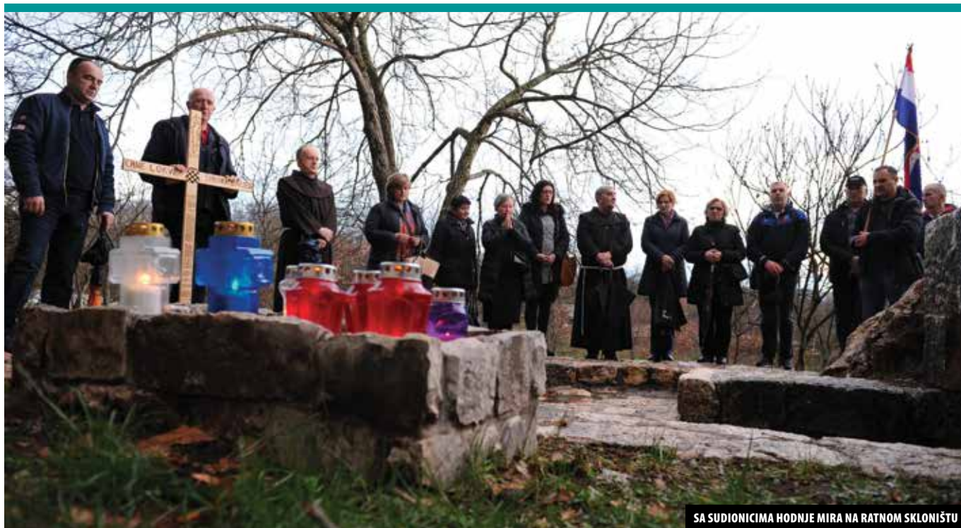
SA SUDIONICIMA HODNJE MIRA NA RATNOM SKLONIŠTU

nađu jedna ili više osoba koje kleče i ostaju dugo u molitvi očekujući zagovor i pomoć naših nevino pobijenih fratara. Isti prizor može se susresti na stratištu, mjestu njihove pogibije. Posebno bih ovdje spomenuo hodočasnike, i naše i one iz inozemstva, koji dolaze poglavito pomoliti se i pokloniti žrtvi naših mučenika. Njihova žrtva nama je i dar jer imamo zagovornike kod Boga, a u ovim teškim vremenima oni su znak nade i poziv na odvažnost, obveza da širimo istinu o njihovu mučeništvu i molimo se da čim prije budu uzdignuti na čast oltara. To bi bio pečat na sve ono što je Široki Brijeg predstavljao, na cjelokupnu njegovu i slavnu i tragičnu povijest te na ono što Široki Brijeg jest danas.