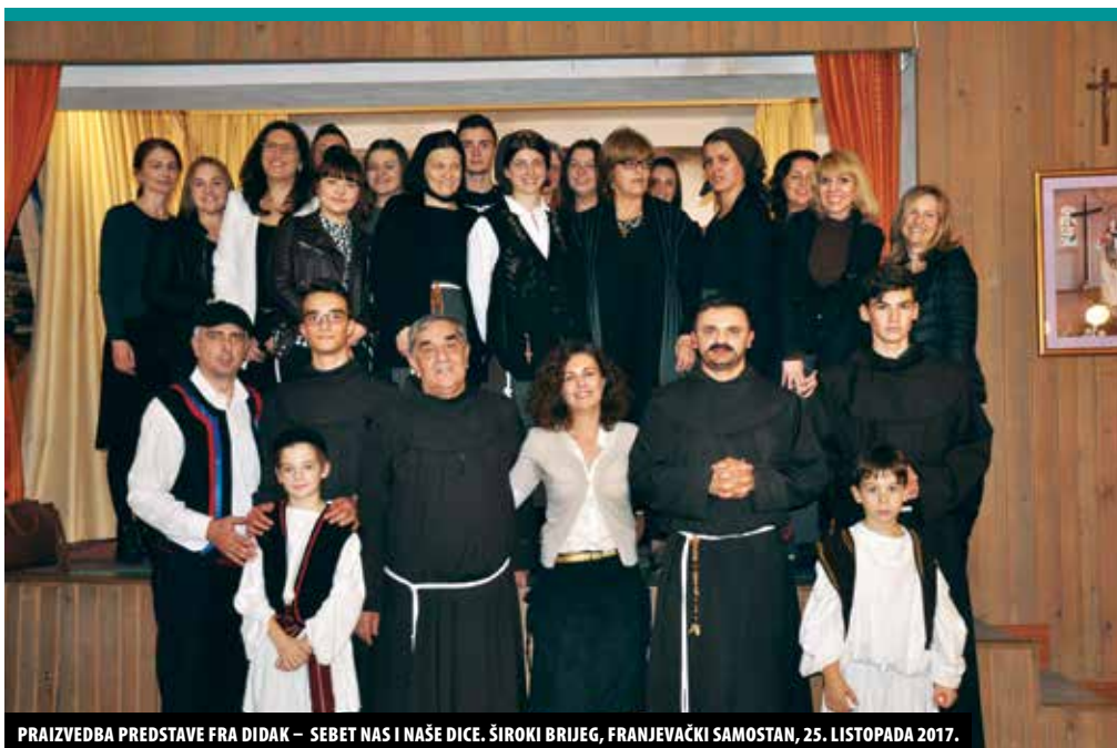
PRAIZVEDBA PREDSTAVE FRA DIDAK – SEBET NAS I NAŠE DICE. ŠIROKI BRIJEG, FRANJEVAČKI SAMOSTAN, 25. LISTOPADA 2017.

Mnogi vjernici poslije mise ostaju pomoliti se na njihovim grobovima. Nije rijetkost da se svakog dana u bilo koje doba dana u crkvi