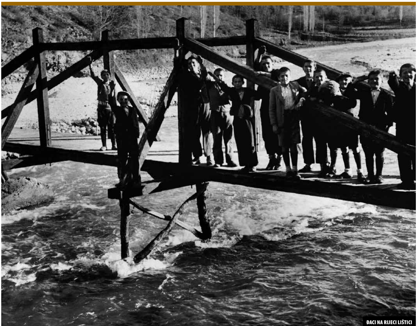
ĐACI NA RIJEČI LIŠTICI