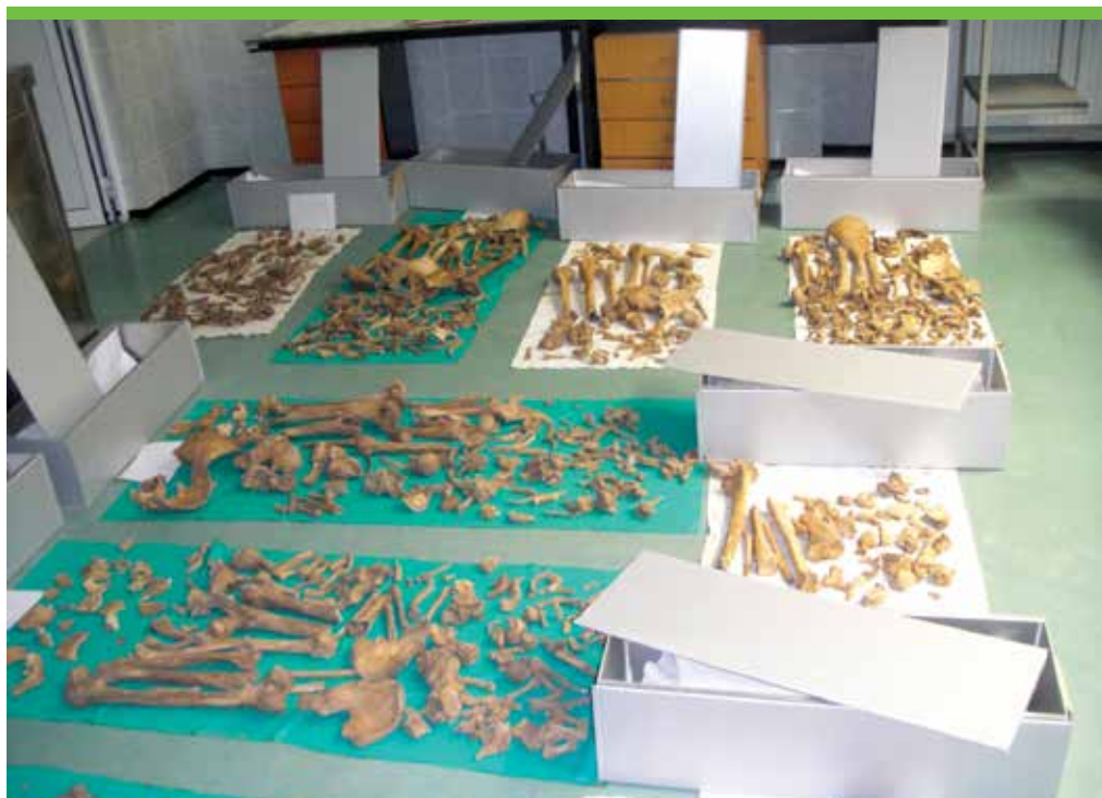
PATOLOGIJA KBC SPLIT: POSMRтни OSTATCI POBIJENIH NA TOMIĆA NJIVI U LJUBUŠKOM, OTKOPANI 2010. MEĐU 28 UBIJENIH BILI SU I FRA MARTIN SOPTA TE FRA SLOBODAN LONČAR.

organ ubrzo sastavio listu svih »sumnjivih i opasnih« elemenata tog područja, koje je trebalo eliminirati i ubiti.