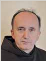
FRA MILJENKO STOJIĆ

Bila je večer, 30. listopada 1944., negdje oko 21 sat. Fra Križan Galić je u župnom uredu u Međugorju molio časoslov. Kroz otvoreni prozor doletjela mu je bomba. Teško je ranjen. Izdahnuo je sutradan ujutro, 31. listopada.