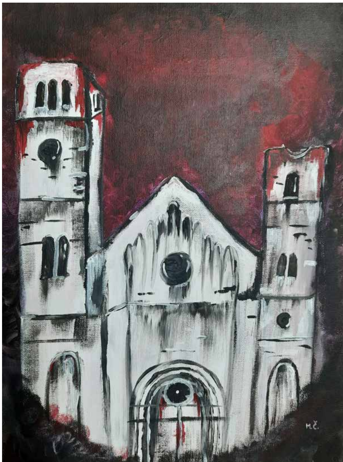
Mihaela Čuljak, VI.d r. 1. OŠ Široki Brijeg, Uzalud im bi (akril na ljepenci, 40 x 30 cm, 2021.)