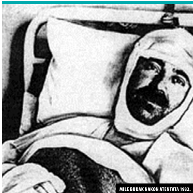
MILE BUDAK NAKON ATENTATA 1932.

opisuje hrvatsko iskustvo u Jugoslaviji i predviđa rat između Hrvatske i Srbije kao rješenje hrvatskoga pitanja.