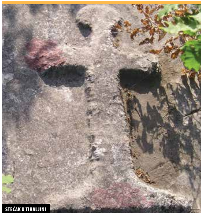
STEAČAK U TIHALJINI

Sv. Ilija Prorok slavi se u Tihaljini od pamtivjeka, iako je i župa i župna crkva posvećena Bezgriješnu začecu Blažene Djevice Marije. ✍