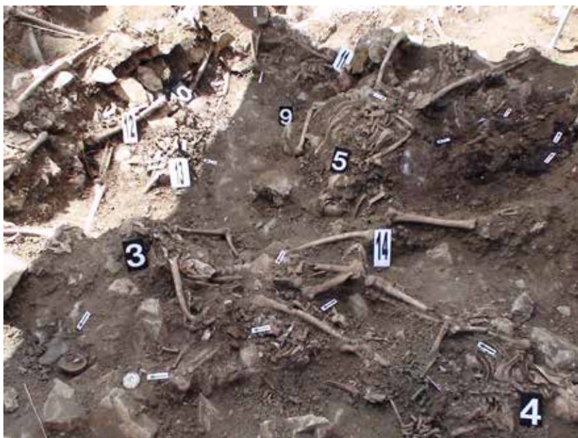
Masovna grobnica na Tomića njivi u Ljubuškom. Posmrtni ostatci fra Slobodana Lončara su pod br. 5, a fra Martina Sopte uz njega prema gornjem desnom dijelu fotografije. Pronađeni su u srpnju 2010.

kaže: Što ja znam što tko misli, nego – Što ja znam što ja mislim!