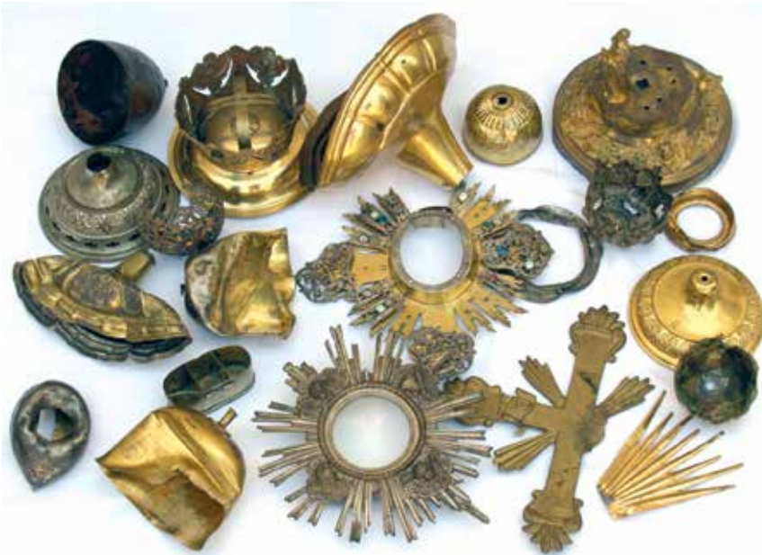
Ostatci misnog posuđa kojeg su na Širokom Brijegu porazbijali jugokomunisti

fra Ratimir Kordić, Fratar – narodni neprijatelj , K. Krešimir, Zagreb, 1995., str. 27. – 28.; 32.; 54. – 67. ✍