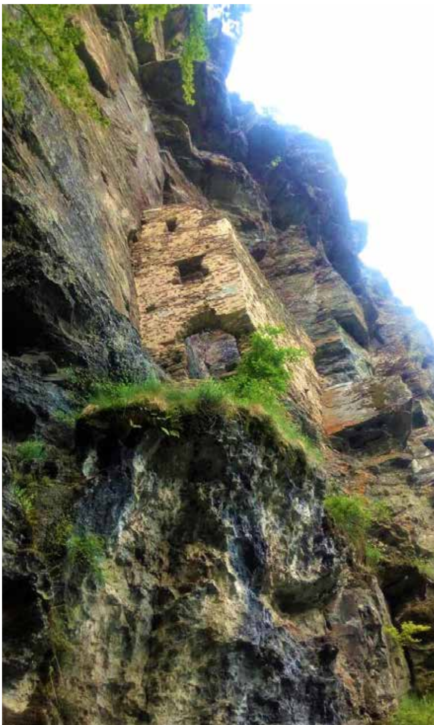
Današnji ostatci Kaštela na planini Zahor. Za vrijeme osmanskog osvajanja Bosne u svibnju 1463., franjevci na čelu s fra Anđelom Zvizdovićem sklonili su se u Kaštele. Odatle je fra Anđeo Zvizdović krenuo na polje Milodraž susresti se sa sultanom Mehmedom II.

jedini slijedili turske vojske preko Slavonije i Ugarske do bedema Budima. Poslije oslobođenja ovih krajeva više nisu bili potrebni!