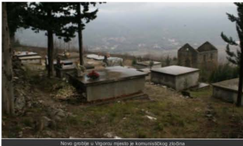
Novo groblje u Vrgorcu mjesto je komunističkog zločina

Treći predsjednik Republike Hrvatske dr Ivo Josipović pod geslom nove pravедnosti do sada je posjetio priličan broj poznatih i znamenitih stratišta mjesta masovnih likvidacija civilnih i vojnih žrtava minulih ratova 20 stoljeća.