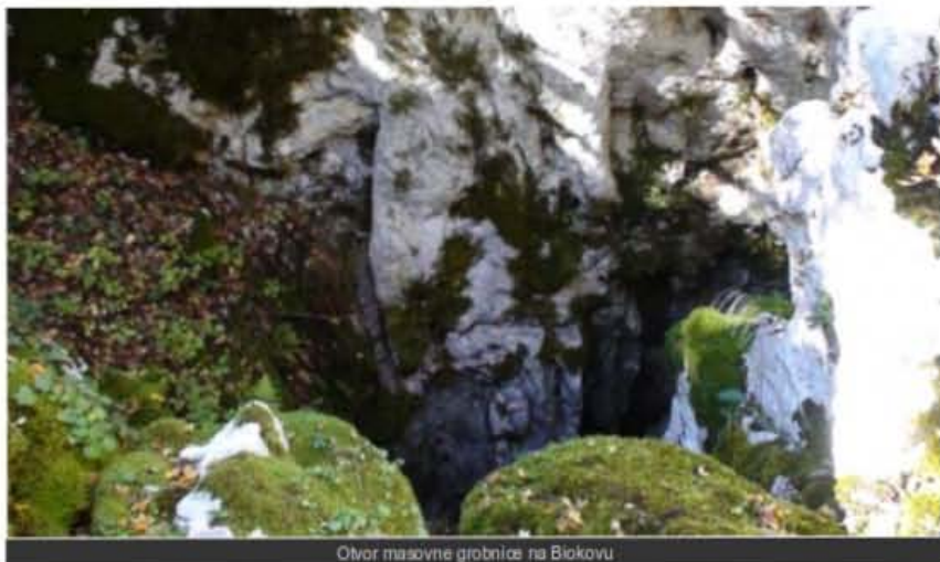
Otvor masovne grobnice na Blokovu