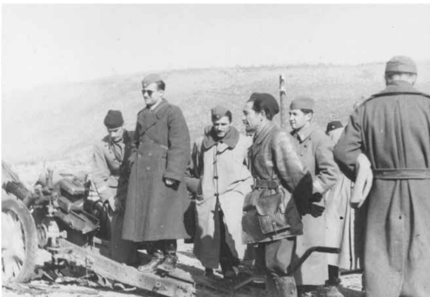
Štab IV. armije, Široki Brijeg, 1945.