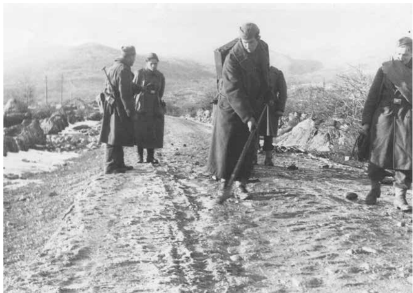
Istraživanje minskih polja poslije osvajanja Širokog Brijega, 8. veljače 1945.

Izvori ukazuju na to da su partizani počinili svoje zločine protiv franjevaca na dva načina. Razlikuju se, naime, zločini počinjeni nad hercegovačkim franjevcima u Ljubuškom i Širokom Brijegu od onih počinjenih nad mostarskim franjevcima. Promatrano s vojnoga gledišta, Tito je izravno rukovodio snagama VIII. dalmatinskoga korpusa u mostarskoj operaciji u veljači 1945. Kada je riječ o borbama za Široki Brijeg, glavni su napadi usmjereni na područje franjevačkoga kompleksa, samostanske crkve i gimnazije. Na tom pravcu