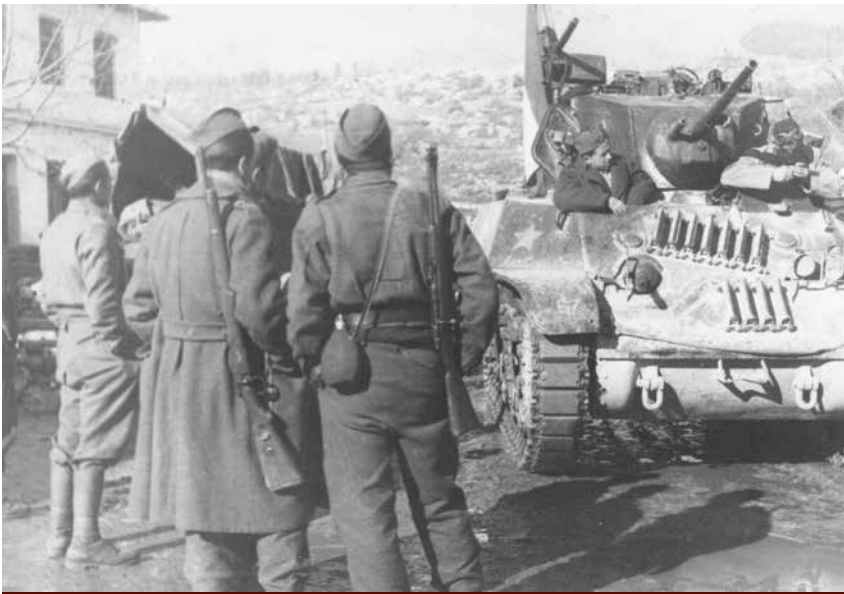
Pripadnici I. tenkovske brigade u borbi za Široki Brijeg u veljači 1945.

tva u Mostaru uputio službeni dopis. U njemu je naveden popis prostora u Provinciji koje je zauzela njemačka vojska na Širokom Brijegu, Humcu i u Duvnu. Između ostaloga, u pismu moli da se strogo poštuje samostanski prostor i klauzura, da u njega ne ulaze ženske civilne osobe te da zapovjednici i gvardijani samostana dogovore visinu odštete za oduzeti prostor i sav inventar koji se u njemu zatekao. Vrijeme nije išlo u korist pučanstvu Hercegovine, pa ni članovima Provincije jer su njemačke postrojbe smetale djelovanju hercegovačkih franjevacu. Točka sukoba između hercegovačkih franjevacu i njemačkih vojnih vlasti dosegla je vrhunac 14. siječnja 1944. kada su saveznički zrakoplovi bombardirali vojne položaje njemačkih oružanih snaga i NDH. U savezničkim zračnim napadima na Mostar i okolice tijekom 1944. poginule su 382 osobe. Upravo je nazočnost njemačke