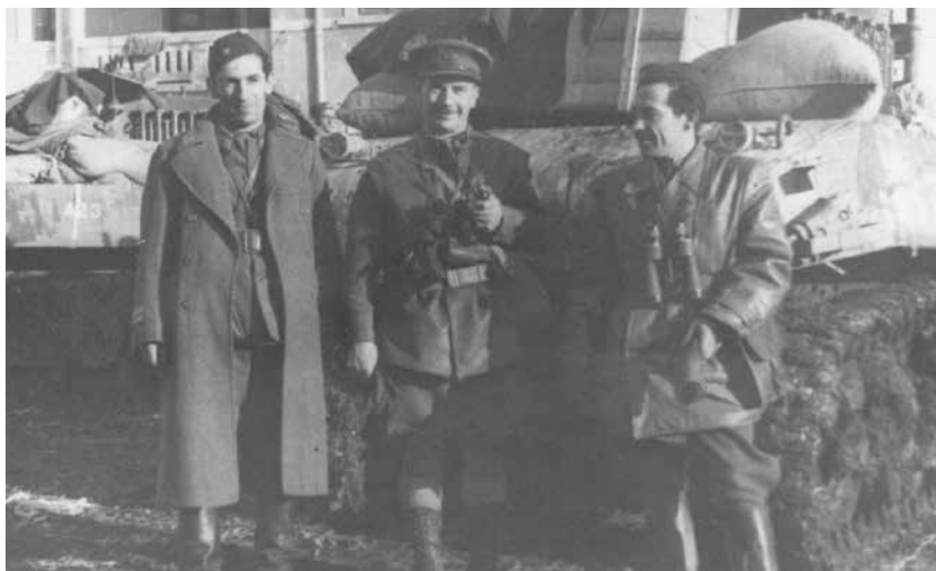
Poslije borbi za Široki Brijeg 8. veljače 1945.

– Osim zračnih napada, franjevačka crkva i samostan gađani su i topničkim i tenkovskim hitcima. Analizom korpusnih, divizijskih i brigadnih zapovijedi za napad dolazi se do zaključka kako je uporabom tenkova i topništva te definiranjem vatrenih ciljeva izravno zapovijedao štab VIII. dalmatinskog korpusa. Možemo zaključiti da je samostan na Širokom Brijegu, koji je tih dana izravno pogođen oko 304 puta, još u pripremljenoj zapovjedi za napad odabran kao vojni cilj. Kad se to sagleda u kontekstu dostupnih obavještajnih podataka koji kazuju da su težišne otporne točke bile Šuškov i Burićev brijeg, onda se sam po sebi nameće zaključak da samostan i crkva nikako nisu mogli, a ni trebali, biti vojni ciljevi, a pogotovo ne »legitimni vojni ciljevi«. O tome kako je to u praksi izgledalo svojedobno je fra Zlatku Sivriću svjedočio nekadašnji niži časnik NOVJ-a doktor Savin, tada zapovjednik jedne topničke baterije naoružane haubicama, koja je za vrijeme borbi bila smještena u Šarića Dubravi kod Ljubotića: »Od položaja nismo ništa mogli vidjeti. Dobili