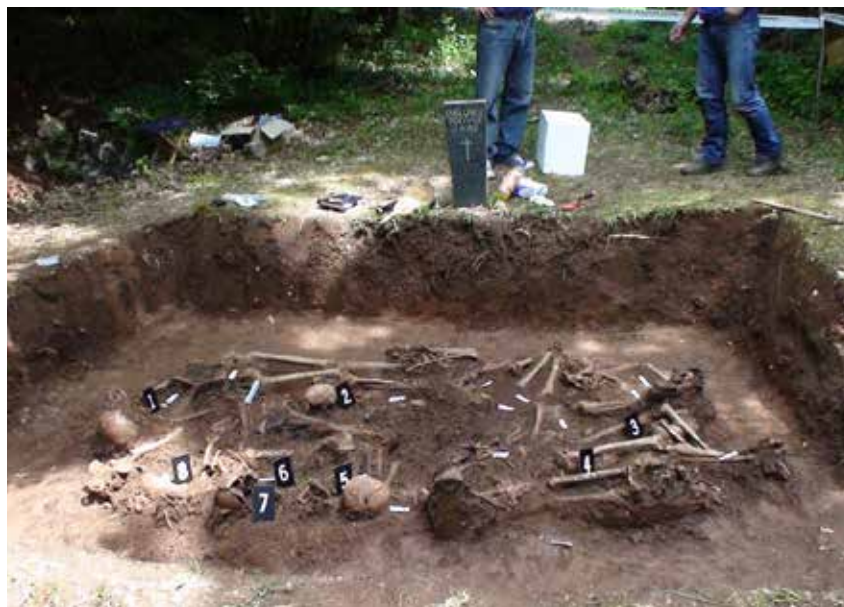
Jedna od masovnih grobnica nastala nakon što su jugokomunisti prošli kroz Široki Brijeg

Hercegovački franjevci ubijeni su ponajprije iz mržnje prema vjeri. Drugi razlog je taj što su bili nekompromitirani pristaše demokracije zapadnoga tipa te su političko rješenje vidjeli u utemeljenju hrvatske države. Sa svime time predstavljali su ideološku prijetnju jugokomunistima za uspostavu njihove revolucionarne vlasti.