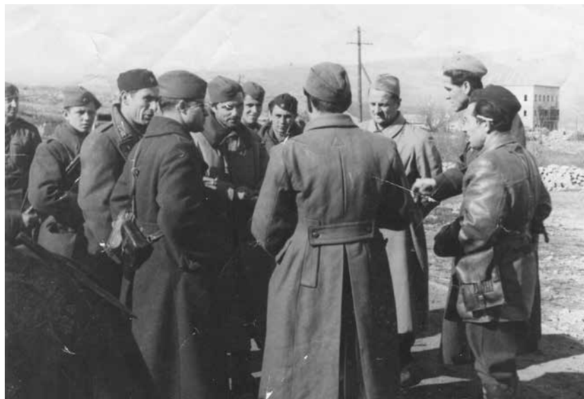
Štab IV. armije u Širokom Brijegu u veljači 1945.

– Talijanske vojne vlasti nastojale su disciplinirati hercegovačke fra-