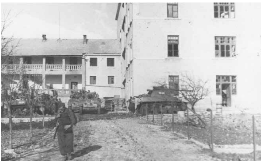
Jedinice I. tenkovske brigade pred konviktom u Širokom Brijegu u veljači 1945.

Njemačke i NDH na tzv. zelenoj crti. Postrojbe 29. hercegovačke divizije privede su kraju pripreme za osvajanje Konjica. Namjera štaba 29. hercegovačke divizije bila je poglavito da se zauzimanjem Konjica i Ivan sedla na području Mostara, Širokog Brijega i Nevesinja prekine veza između njemačkih i oružanih snaga NDH sa Sarajevom. Oru-