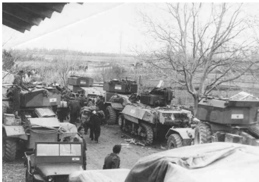
I. tenkovska brigada na polaznom položaju za napad na Široki Brijeg u veljači 1945.

nu infrastrukturu koja je bila glavna meta diverzija četnika i partizana. Početno oduševljenje hercegovačkih franjevaca njemačkim vojnim vlastima pretvorilo se u stalne nesporazume i sukobe koji će potrajati do kraja rata. Razlog sukobima je u tome što su njemačke vojne postrojbe zauzele franjevačke samostane i župne uredi diljem Hercegovine. Najviše štete franjevačkom samostanu na Širokom Brijegu zadale su njemačke vojne postrojbe. Ondašnji širokobriješki gvardijan fra Bože Bubalo u pismu od 2. travnja 1943. piše fra Dominiku Mandiću i, između ostaloga, ističe kako je njemačka vojska zaposjela cijelu gimnaziju, dio konvikta, dobar dio sjemeništa i samostana. Riječ je o postrojbama 7. SS dragovoljačke gorske divizije »Princ Eugen«. Provincijal fra Leo Petrović obavijestio je sve upravitelje franjevačkih školskih ustanova da mu točno jave kada je vojska ušla u te prostore, naziv postrojbi koje su zauzele prostore i provincijski inventar. Takvo stanje uzrokovalo je neredovitost nastave u Franjevačkoj klasičnoj gimnaziji na Širokom Brijegu i ostalih franjevačkih odgojnih zavoda u samostanima na Humcu i u Duvnu. Provincijal Petrović je 7. travnja 1944. na adresu njemačkoga vojnoga zapovjedniš-