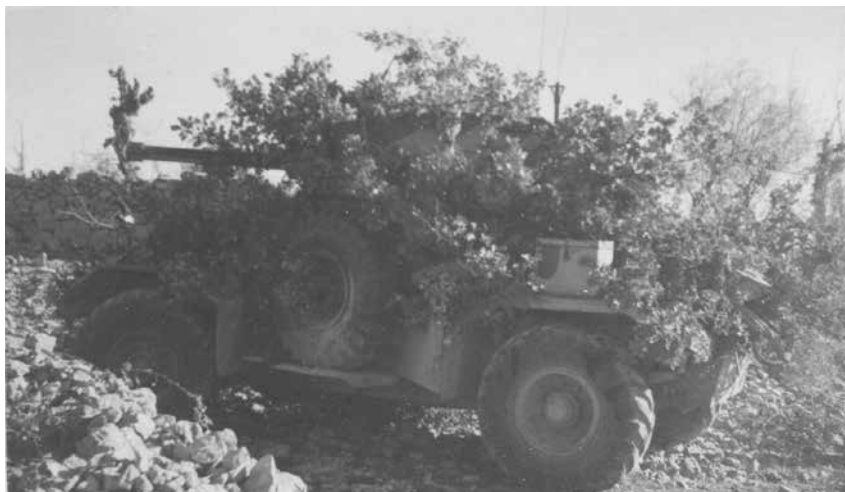
Maskirana oklopna kola I. tenkovske brigade pred napad na Široki Brijeg 5. veljače 1945.

Ipak, glavni razlog pokretanja operacije Bura bili su obavještajni podatci koje je stožer 369. pješačke divizije njemačke vojske dobio o aktivnostima nekoliko partizanskih brigada – 11. i 14. hercegovačke brigade 29. hercegovačke divizije – koje su se preko snijegom pokrivenih planina istočne Hercegovine, koncem siječnja 1945., uspjele probiti na područje Konjica. Na temelju naredbe II. udarnog korpusa NOVJ-a 29. hercegovačka divizija pripremala je razbijanje položaja oružanih snaga